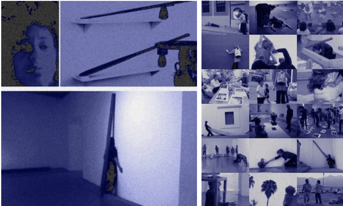
PELIGRO Oaxaca 2017 Mexique. Sofi Hémon. action. pas d'action. RENCONTRES